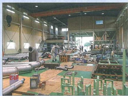
■植木支店・工場内部