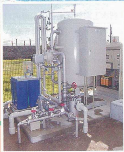
弊社製造の循環ろ過機システム