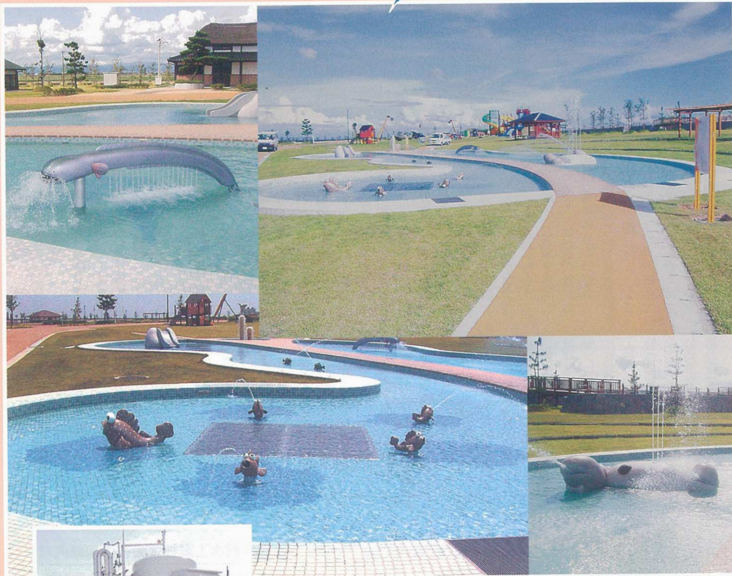
弊社施工：佐賀県東与賀町「干潟公園」