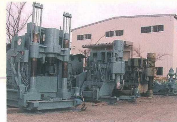
我社の温泉掘削マシン 左から利根リゾート21 1台 利根TL2000 2台 掘削能力1000~1500m