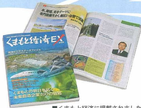
■くまもと経済に掲載されました。

その為には今何をすべきか！を考えなくては我社の将来はあり得ません。 目下、私共熊本利水工業は今後も公共工事の営業力を維持しながら新たな事業を展開しようと考えています。色々な観点から検討し勉強を重ねて近い将来、準備が整った段階で発表したいと考えております。ただここで言える事は、何をやるにしても全社員が気持ちを一つにして、「全社一丸」になることが肝要であります。 その意味に於いても社内報(すい)はその一助になつてくれるものと思います。皆様も奮って投稿して貰いたいし全員で作る社内情報誌でありたいと考えます。よろしく願います。