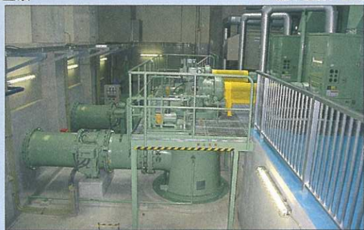
■800φ立軸斜流ポンプ(天草市河浦町 雨水ポンプ場)