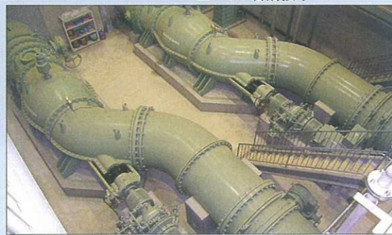
■1500φ横軸斜流ポンプ(山鹿市藤井川北地区 排水機場)