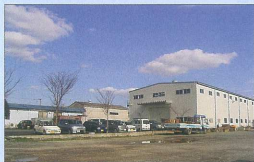
■植木支店・工場全景