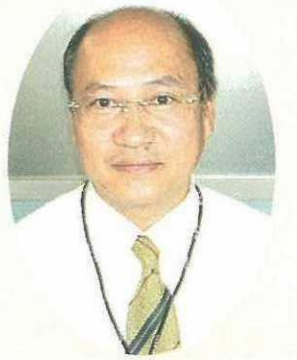
工事部 さく井工事課主任

社長自ら大型マシンの追加購入を決定され、深堀りや大口径の同時着工も可能となりました。結果的により一層のコストダウンにつながっております。 最近では各地の公共施設の井戸の計画や設計等、コンサルや事業団よりの信頼もあり、又温泉の計画設計、施工依頼される事もあります。 今後現況に甘んじることなく、お客様第一主義で現場との連携を取りながら益々の信用、信頼を得る様さく井工事部一丸となって努力して行きたいと思っております。